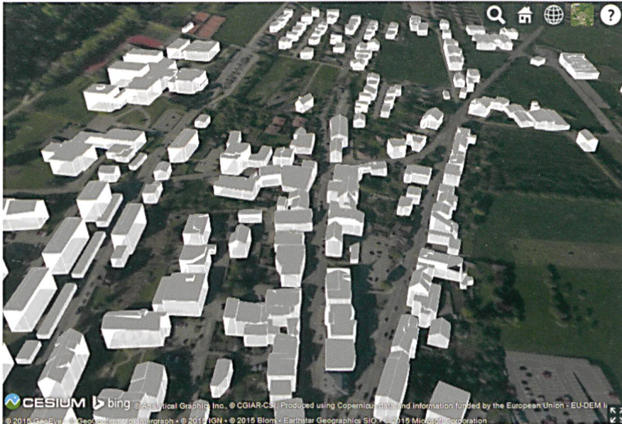
Fig. 2: Travail de Master N. Delley: maquette 3D dans un navigateur web.

à 7», guichet cantonal de suivi des projets, formation aux démarches participatives, modalités d'évolution du cadre réglementaire, etc.) afin de fluidifier les relations entre acteurs impliqués dans ces projets.