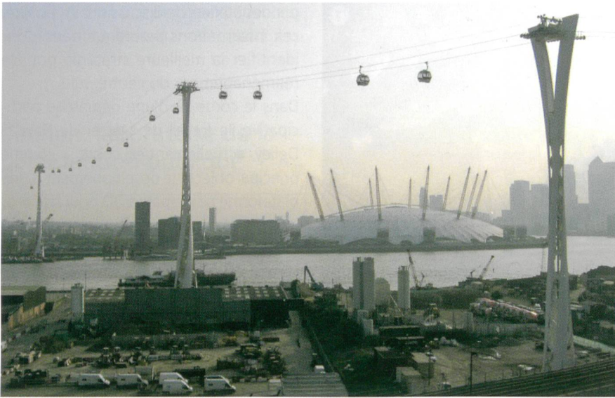
Fig. 3: «Emirates Air Line towers 24 May 2012»

à la circulation aérienne indépendante des aléas du trafic routier;