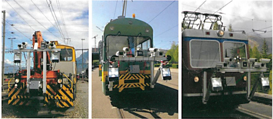
Abb. 3: Der Rail Track Scanner aus dem TQual-Projekt im Einsatz bei der Rhätischen Bahn, den Verkehrsbetrieben Zürich und der Gornergratbahn.

Im Projekt GeoAR zur Nutzung von Augmented Reality im Geoinformationskontext konnte 2015 die Entwicklung zweier innovativer AR Apps initialisiert werden: die Augusta Raurica AR App, eine mobile Anwendung für die zukünftigen Besucherinnen und Besucher der Römerstadt mit einer Reihe von AR-Funktionen sowie die Swissarena App, eine Augmented Reality App für die Swissarena im Verkehrshaus Luzern. Beide Apps sollen im