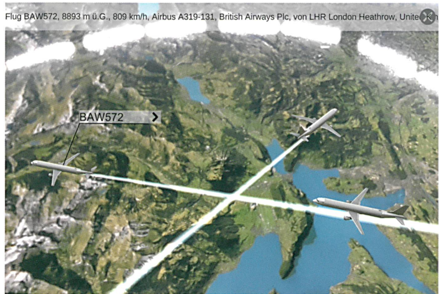
Abb. 4: Überlagerung von Flugzeugen mit den dazugehörigen Informationen auf dem Luftbild der Swissarena.

Mit dem Prototyp konnte gezeigt werden, dass sich die Swissarena für die interaktive Nutzung mithilfe einer AR-Applikation sehr gut eignet. Auch erste Nutzungen liessen das Begeisterungspotenzial mit dieser Technologie klar erkennen. Die entwickelte Markerkombination lässt die App von unterschiedlichen Positionen in der Swissarena einsetzen. Bei starker Abweichung der horizontalen Lage, dem Wegschwenken vom Luftbild oder einer starken Abdeckung durch Personen auf dem Luftbild stösst auch die Anwendung an ihre Grenzen. Die Gestaltung und Inhalte der App lassen sich noch stärker auf den Einsatz in der Swissarena abstimmen respektive erweitern. Das nicht interpretierte Luftbild kann durch virtuelle Inhalte einfacher verständlich gemacht werden und dient als räumliche Referenz für thematische Informati-