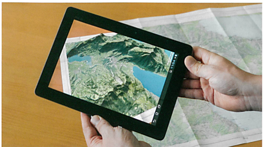
Abb. 1: Augmented Maps im Einsatz.

Im Projekt GeoAR ( www.fhnw.ch/habg/ivgi/forschung/geoar ) wird untersucht,