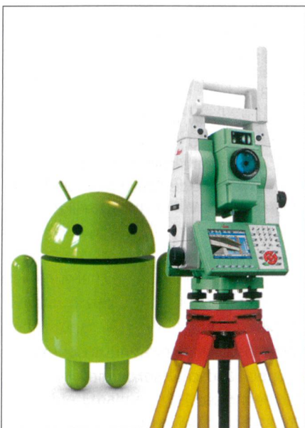
Abb. 1: Android-App.

Die KSL Ingenieurbüro AG beschäftigt zurzeit 44 Mitarbeitende in den Geschäftsbereichen Infrastruktur, Geomatik,