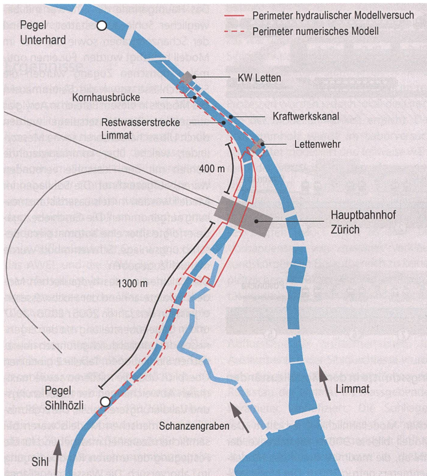
Abb. 1: Untersuchungsgebiet Sihldurchlässe (VAW, mod. nach EWZ).

chen Veränderungen. Für die Untersuchung der Abflusskapazität der Sihldurchlässe wurde daher zwischen dem Zustand 2006 – vor dem Bau der DML – sowie dem Zustand 2014 – nach Abschluss der Bauarbeiten – unterschieden.