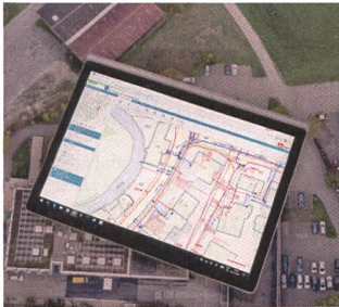
Abb. 1: Werkleitungsdaten im neuen WebGIS.

WebGIS-Thurgau ist eine einfache Gesellschaft mehrerer Ingenieur-Büros in der Ostschweiz, welche ihren Kunden – mehrheitlich Gemeindeverwaltungen und Werksbetreiber – umfassende WebGIS-Dienstleistungen anbietet. Eine Übersicht über das Leistungsspektrum von WebGIS Thurgau findet sich unter http://wgis.ch .