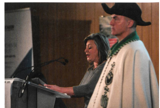
Fig. 1: Mme la Conseillère d'Etat Nuria Goritte pendant son allocution.

Nous avons pourtant envie de faire parler de nous, et ce magnifique anniversaire en est l'occasion privilégiée. Nous devons par exemple songer à renouveler nos effectifs, et les tropismes actuels de nos sociétés nous mettent en concurrence directe avec des métiers bien plus vi-sibles, plus faciles à appréhender, et donc bien plus séduisants. Propageons-donc tous ce beau message: le métier de géo-mètre est extraordinaire, alliant travaux de terrain et activités de bureau, avec à la fois des composantes techniques très pointues et en même temps d'autres très centrées sur les relations humaines, l'en-tremise, le lien social, faisant pénétrer