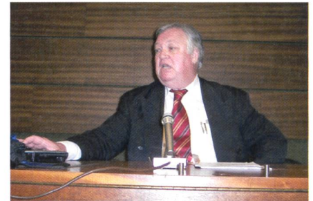
Abb. 1: IGS-Präsident Jean-Luc Horisberger.

Der Prozess der RAV, ein langfristiges Unternehmen, startete zu Beginn der 80er-Jahre. Er endete mit dem Inkrafttreten der entsprechenden Bundesverordnungen im Jahr 1993. Das Konzept der RAV wurde zwar durch die Bundes- und Kantonsbehörden und selbstverständlich durch den SVVK entwickelt, stellte die GF SVVK jedoch bezüglich ihrer Umsetzung