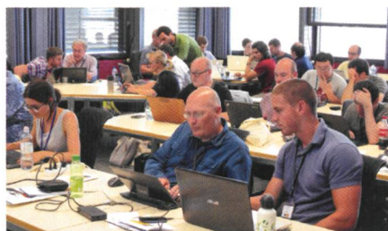
Abb. 3: GeoPython Konferenzteilnehmende.

Ziel des neuen KTI-Projekts BIMAGE ist die Realisierung von cloudbasierten 3D-Bilddiensten für das Building Information Management. Dazu soll u. a. ein System zur effizienten bildbasierten 3D-Innenraumerfassung entwickelt werden.