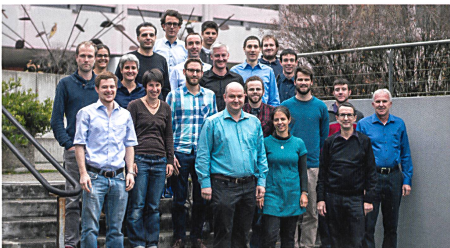
Abb. 1: Team des Instituts Vermessung und Geoinformation FHNW.

Zur Vorbereitung der Kandidatinnen und Kandidaten für die Geo-Olympiade 2017 in