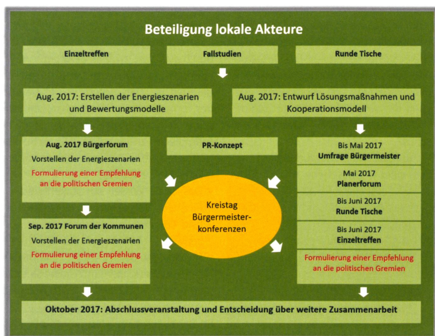
Abb. 3: Beteiligung lokaler Akteure und politische Entscheidungen in EnAHRGie.

Das Forschungsprojekt dient hierbei als Plattform für bereits aktive Akteure aus der Modellregion, die sich dabei vernetzen, mittelfristig eigene Kapazitäten und Erfahrungen aufbauen und neue Ideen für die Herausforderungen der lokalen Energiewende für den Landkreis erarbeiten. Die in Abbildung 2 dargestellten Lokalakteure und Organisationen dienen als Bindeglied zwischen der Arbeit der Innovationsgruppe am Energiekonzept und den betroffenen Akteursnetzwerken in der Modellregion. Lokale Energieversorger, Banken und Unternehmen spielen insbesondere als Projektentwickler, Investoren, aber auch als Impulsgeber neuer