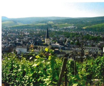
Abb. 1: Ahrweiler.

Konkurrenz in ohnehin schon durch unterschiedliche Landnutzungsarten belastete Räume darstellen. Die folgenden Ausführungen beziehen sich auf Ergebnisse und Erfahrungen aus dem laufenden Verbundprojekt EnAHRgie ( www.enahrgie.de ). Als Untersuchungsregion wurde hierfür der Landkreis Ahrweiler, Deutsch-