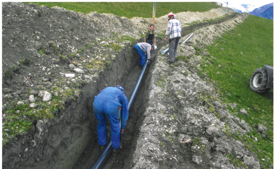
Abb. 3: Verlegung der Rohre.

Das landwirtschaftliche Bildungs- und Beratungszentrum Plantahof (LBBZ) startete Ende 2008 mit den interessierten