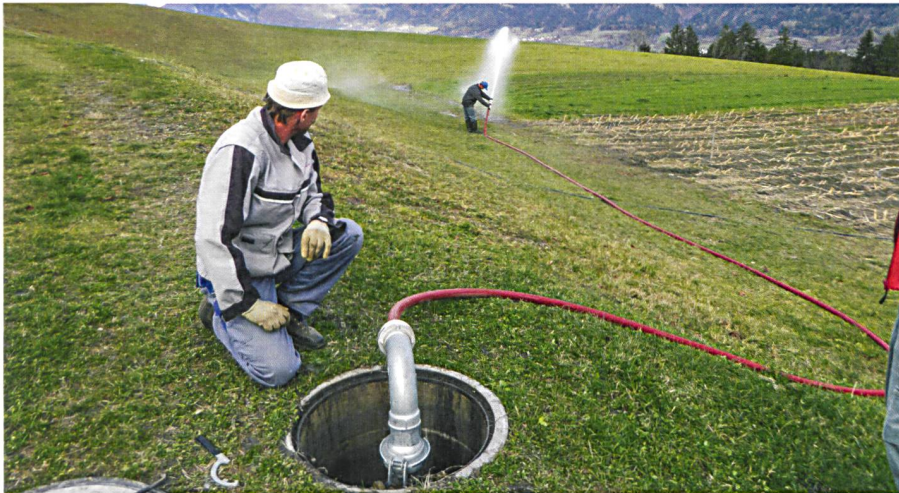
Abb. 4: 1. Entleerung 15. November 2016.

Die Bewässerung erfolgt mit einem Bewässerungsautomaten (in Beschaffung durch die Genossenschaft).