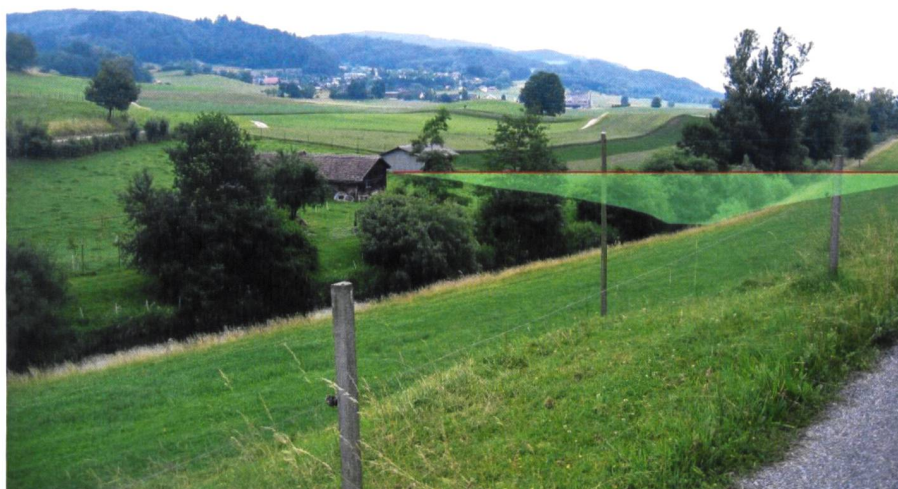
Abb. 2: Blick auf den Standort des geplanten Hochwasserrückhaltebeckens in der Gemeinde Staffelbach. Beim Bau lässt sich die Topografie der Endmoräne des Reussgletschers ausnutzen.

Von 2008 bis 2011 wurde das Vorprojekt «Hochwasserschutz Suhrental» mit dem Bau eines Hochwasserrückhaltebeckens in Staffelbach sowie Ausbaumassnahmen an der Suhre ausgearbeitet. Parallel dazu und mit ständigem koordinativem Austausch fand die Vorplanung der Gesamtmelioration statt, welche wie oben erwähnt, nicht wie üblich durch die Bewirtschafter oder die Gemeinde, sondern durch den Kanton initialisiert wurde. Die Realisierung der Hochwasserschutz- und Revitalisierungsprojekte benötigt Land. Idealerweise kann den von den Massnahmen betroffenen Landwirten Realersatz angeboten werden. Für das Hochwasserrückhaltebecken und die Suhrerevitalisierung (mit Fläche für den Dammbau und Gewässerraum) müssen 8.5 ha Land erworben werden. Für Hochwasserschutzprojekte und Offenlegungen von Seitenbächen werden weitere 6 ha Land benötigt. Die Gesamtmelioration bildet dabei eine einmalige Möglichkeit, durch gezielte Landumlegungen bzw. Arrondierungen, das Land für das Wasserbauprojekt zur Verfügung zu stellen. Es gibt kein geeigneteres Instrument, um die Auswirkungen des Hochwasserschutzprojektes auf die Landwirtschaft zu