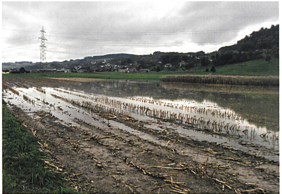
Abb. 4: Vernässungen nach einem Niederschlagsereignis zeigen die Notwendigkeit von Massnahmen an den Drainagen auf.

mildern, die landwirtschaftlichen Produktionsbedingungen zu verbessern und gleichzeitig Vorteile für die Bevölkerung und die Landschaft zu generieren als eine Gesamtmelioration. Ein Landenteignungsverfahren kann umgangen werden und der allenfalls noch notwendige Landabzug für die Wasserbaumassnahmen wird gerecht auf alle Grundeigentümer verteilt.