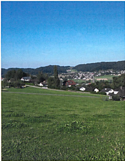
Abb. 3: Landwirtschaftsland in Reitnau. Aufgenommen bei der Evaluation von Massnahmen in Zusammenarbeit mit den betroffenen Landwirten.