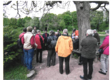
Abb. 3: Aufmerksame Zuhörer im Bally-Park.

etwa zwanzig Minuten zunächst steil bergauf, dann eben auf einem Waldweg und zum Schluss über unzählige Treppenstufen wieder hinunter zur Aussichtsplattform, von der man einen ausgezeichneten Blick auf die Baustelle der Tagbaustrecke des Eppenberg-Tunnels hat und die laufenden Bauarbeiten verfolgen kann. Nach kurzer Zeit war bereits der Rückweg angesagt, um den Bus zurück nach Schönenwerd und zum Schlussstrunk zu erreichen. Dieser Schlussstrunk fand wieder im Hotel Storchen statt. Begleitend zu einem Feierabendbier, einem Glas Wein oder Mineralwasser und Partybrötchen erzählten uns die Damen von ihrem Besuch im Gugelmann Museum und den dort ausgestellten poetischen Maschinen in Betrieb. Damit war der Schlusspunkt des diesjährigen Frühlingsanlasses der Gruppe Senioren erreicht; wiederum angereichert mit vielen gemütlichen, kollegialen Gesprächen mit bekannten und bisher unbekannt Personen. Die positiven Rückmeldungen lassen ohne weiteres den Schluss zu, dass solche Anlässe unter Senioren sehr geschätzt werden.