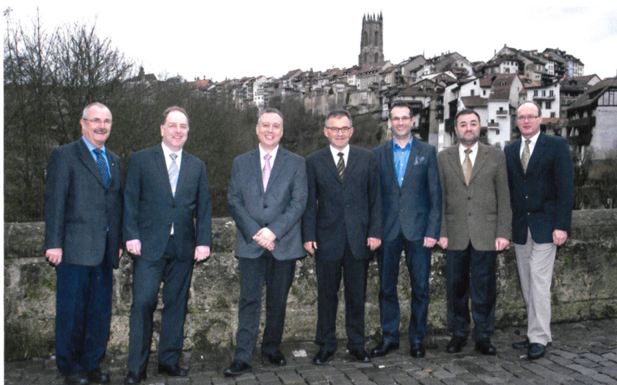
Fig. 15: Séance du comité à Fribourg, 2013.

Dans le cours des développements actuels, le terme de «Public-Private-Partnership (PPP)» a été présenté de manière positive, tout comme celui du développement durable. Ces termes étaient auparavant progressivement tombés en discrédit dans la profession et il fallait expliquer qu'ils existaient depuis longtemps dans un sens positif. Le bon partenariat et la répartition