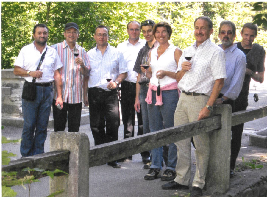
Fig. 13: Séance du comité en 2006.

Les années 60 étaient marquées par la haute conjoncture et les années 70 par la récession. À partir des années 60, l'automatisation et le traitement électronique des données étaient d'actualité. Avec la publication en 1966 des «Directives pour l'introduction du traitement automatique de l'information dans la mensuration cadastrale » par la Direction des mensurations cadastrales, le nouveau tarif pour la mensuration cadastrale était dépassé