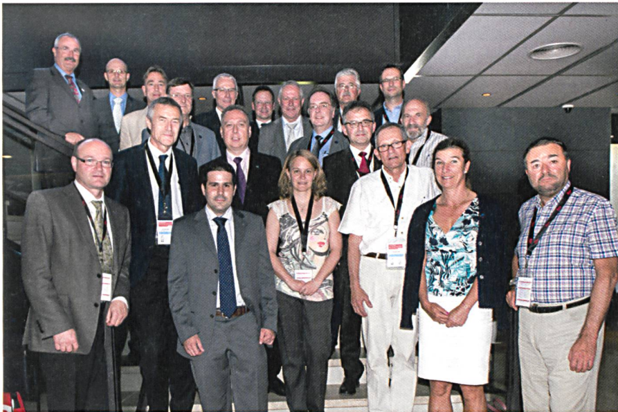
Fig. 16: AG 2013 à Genève.