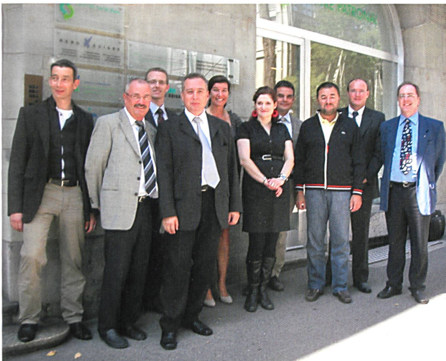
Fig. 14: Première séance du comité au CP, 2010. Abb. 14: Erste Vorstandssitzung im CP, 2010.