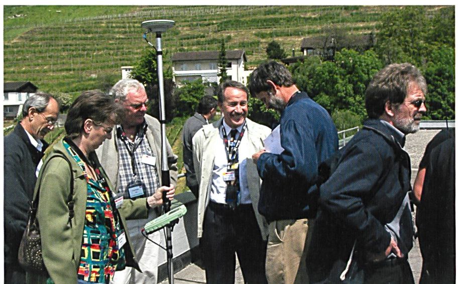
Fig. 12: Excursion chez Leica Heerbrugg, DACH 2005. Abb. 12: Exkursion bei Leica Heerbrugg, DACH 2005.

En 1948, le constat a été fait lors de l'assemblée générale que, «le géomètre n'est pas assez commerçant, un secrétaire commercial important aurait plus de succès lors de négociations tarifaires». La société fiduciaire Visura de Soleure a été engagée en 1949 pour de nouvelles enquêtes sur les frais généraux, elle a également fait des propositions pour la