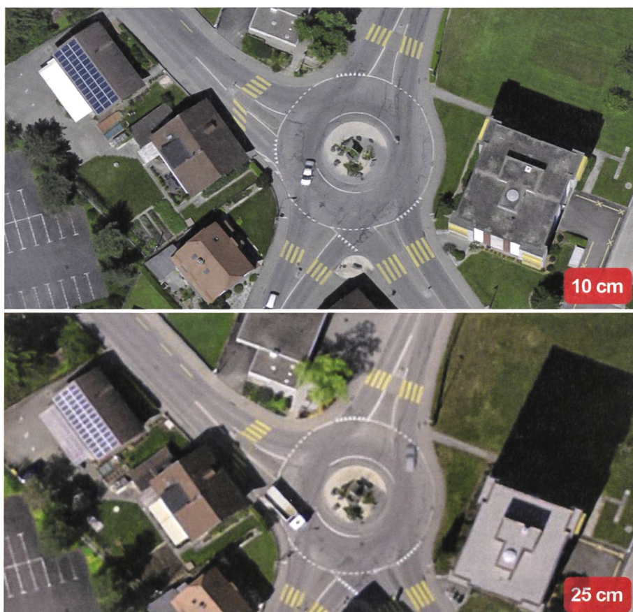
Fig. 6: Etat de la chaussée à 10 et 25 cm.