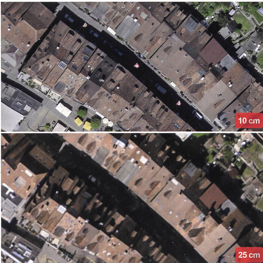
Fig. 5: La vieille ville de Thoun à 10 et 25 cm.

Bien entendu, l'introduction d'un nouveau capteur photographique influence en premier lieu les produits images tels que les bandes d'images aériennes brutes et les orthophotos (SWISSIMAGE et SWISSIMAGE RS). Les résolutions de 25 et 50 cm sont remplacées par du 10 et 25 cm. Ces nouvelles images offrent un niveau de détails accru, une délimitation des objets plus nette et la possibilité de mesurer des éléments du territoire avec une grande précision de \pm 10 cm. Un tel changement nécessite une réorganisation