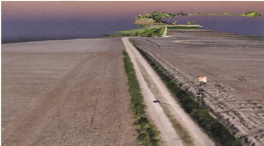
Fig. 1: Le nuage de points colorés résultant, où l'on reconnaît un panneau orange caractéristique et la forme en corridor suivant le tracé.

Le but de la mission était donc de réaliser un corridor de MNT avec une précision de 10 cm ( 1 \sigma ), sur une largeur d'environ 50 m (soit 25 m de part et d'autre du tracé de la conduite) afin de permettre la génération de profils en travers et d'un profil en long axé sur le gazoduc. Le tronçon utilisé pour ce test est le gazoduc G300 12'' Tolochenaz-Orbe, construit en 1973, d'une longueur de 30 km, qui relie les communes de Tolochenaz et d'Orbe dans le canton de Vaud.