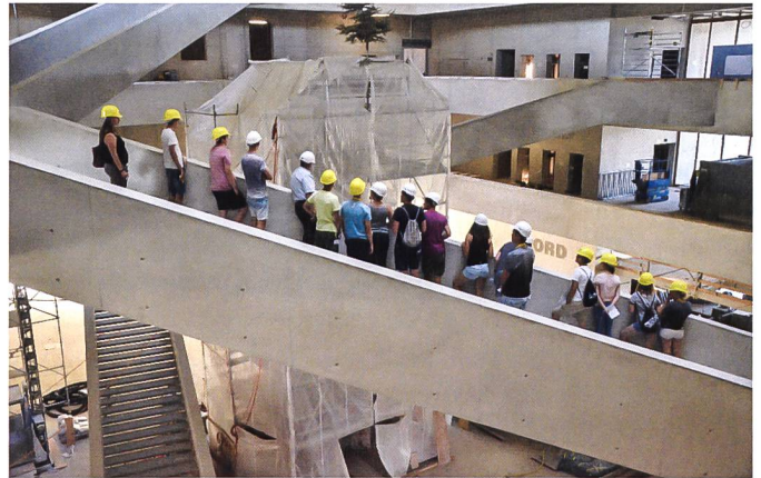
Eindrücke aus dem riesigen Atrium des neuen Kubuk Campus-Gebäudes.

mit den Grundlagen zur Photogrammetriesoftware PhotoScan startete die Gruppe, die sich bereits mit Laserscanning befasst hatte, in den Workshop «3D-Rekonstruktion». In diesem Workshop generierten die Jugendl-