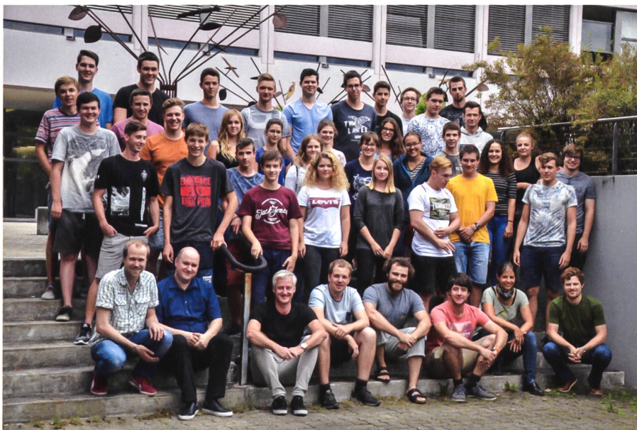
Die Teilnehmerinnen und Teilnehmer an der Geomatik Summer School 2017 und das Summer School Team des IVGI (vorderste Reihe).

Nach einer Einführung in die Photogrammetrie-Aufnahmeplanung am zweiten Tag blieb das Programm rein praxisbezogen. Gerüstet