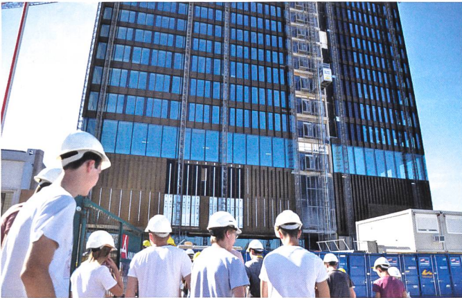
Besichtigung des imposanten neuen FHNW Campus Kubuk in Muttenz.