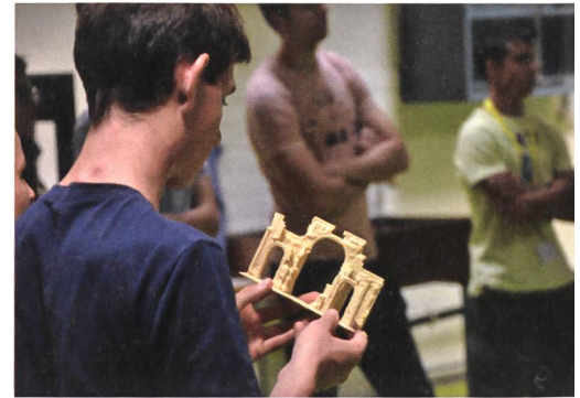
Einblicke ins 3D-Printing.

Am ersten Tag standen nach einer Einführung in die Photogrammetrie drei Theorieblöcke zu den Themen Augmented Reality/Virtual Reality, 3D-Druck und Mobile Mapping auf dem Programm. Am Nachmittag durften die Jugendlichen selbst Hand anlegen. In dreistündigen Workshops bekamen sie eine Ahnung davon, wie diese Technologien im Geomatik-Alltag genutzt werden. Eine Gruppe beschäftigte sich mit der Funktionsweise einer Vermessungs-Drohne. Nach der Programmierung verfolgten sie den Flug über die nahe gelegenen Ruinen von Augusta Raurica und lernten, wie die aufgenommenen Bilder ausgewertet werden. Parallel dazu erhielten die anderen beiden Gruppen eine Einführung in das Programmieren mit Python anhand anschaulicher Beispiele aus der Geoinformationswelt und in das terrestrische Laserscanning. Als Übungsobjekt diente ein Modell des neuen FHNW-Campus Kubuk, der derzeit gebaut wird. Aus drei Perspektiven wurden Laserscans des Modells gemacht und anschliessend zu einem digitalen 3D-Modell zusammengefügt. Mit Cyclone und 3D-Reshaper lernten die Jugendlichen den Umgang mit professioneller Software kennen und bekamen die Gelegenheit, mit den Parametern zu experimentieren.