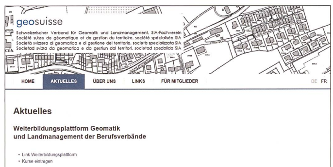
Fig. 5: Website geosuisse. Abb. 5: Website geosuisse.