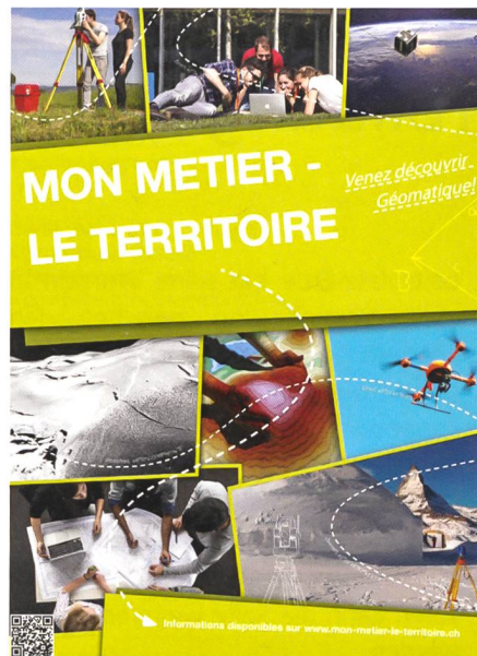
Fig. 2: www.mon-metier-le-territoire.ch .

rer Zeit steht sämtlichen Organisationen unsere Weiterbildungsplattform offen. Auf dieser können Kurse und Veranstaltungen selbstständig eingetragen werden und mit Ablauf der Anmeldefrist fällt diese aus dem «Bildungskalender». Wo findet sich diese Weiterbildungsplattform? Wählen Sie den