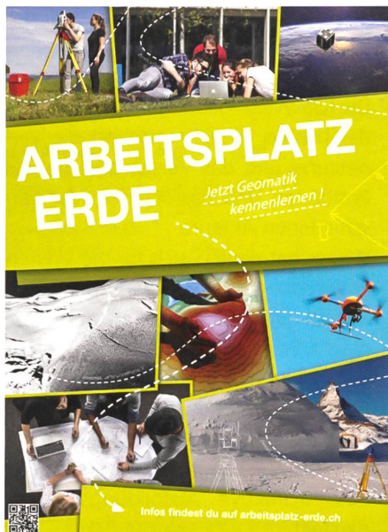
Abb. 2: www.arbeitsplatz-erde.ch .