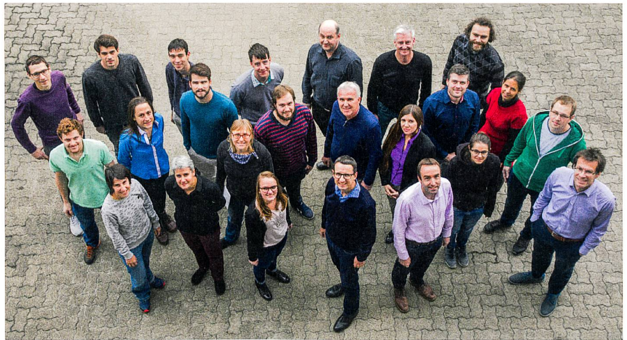
Das Team des Instituts Geomatik der FHNW (Nov. 2017).

Nach der Pensionierung mehrerer Professoren in den Jahren 2016 und 2017 ist das In-