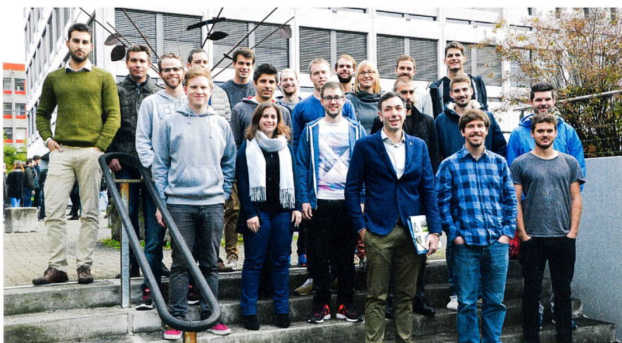
MSE Masterstudierende beim Start des Herbstsemesters 2017.

Die Fachtagung 3DGI 2017 vom 13. Juni 2017 war ebenfalls ein grosser Erfolg! Die Tagung unter dem diesjährigen Motto «3D-Geoinformation – der Schlüssel zur digitalen Realität» wurde einmal mehr unter dem Lead des Instituts Vermessung und Geoinformation (IVGI) der FHNW Muttenz organisiert und durchgeführt. Über 200 Personen aus der Schweiz und dem nahen Ausland haben die Veranstaltung am FHNW Standort Olten besucht.