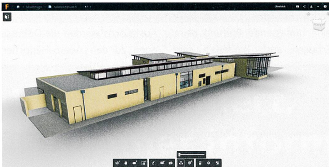
Modellvisualisierung des IFC Files.

GEOBOX AG Technopark Winterthur Technoparkstrasse 2 CH-8406 Winterthur Telefon 041 44 515 02 80 info@geobox.ch www.geobox.ch