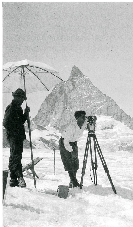
Abb. 1: Theodulgletscher: Fotogrammetrische Station, 1930.

Die terrestrischen Aufnahmen wurden im Rahmen des Massnahmenplans zur Erhaltung des raumrelevanten Kulturguts von swisstopo gescannt. Die verschiedenen damals erfassten historischen Parameter (z.B. die Orientierungen der Aufnahmen)