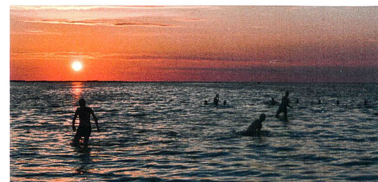
Abb. 5: Nachtbad Insel Hiiumaa.

Von 9 Uhr morgens bis 9 Uhr abends sind heute drei Busfahrten, eine Fähre und eine Autofahrt geplant, um von Rīga auf die estnische Insel Hiiumaa zu gelangen. Ein dreistündiger Zwischenstopp in Pärnu wird fürs Mittagessen und einen Stadtspaziergang genutzt. Nach kurzer Ungewissheit, ob wir einen Bus finden, der uns alle von Tallinn bis zur Insel bringt, haben wir es schliesslich aufgeteilt in zwei Busse geschafft (besten Dank an die nur estnisch und russisch sprechenden Buschauffeure!) und können auf der Fähre die Sonnenstrahlen geniessen. Am Hafen Heltermaa auf Hiiumaa holen uns die Inhaber unserer Ferienhäuser ab und fahren uns mit dem Auto zu den hübschen Holzhäuschen in der wilden estnischen Natur. Da der Strand nur wenige hundert Meter entfernt ist und es noch herrlich warm ist, können wir den Sonnenuntergang um halb elf im Meer schwimmend beobachten.