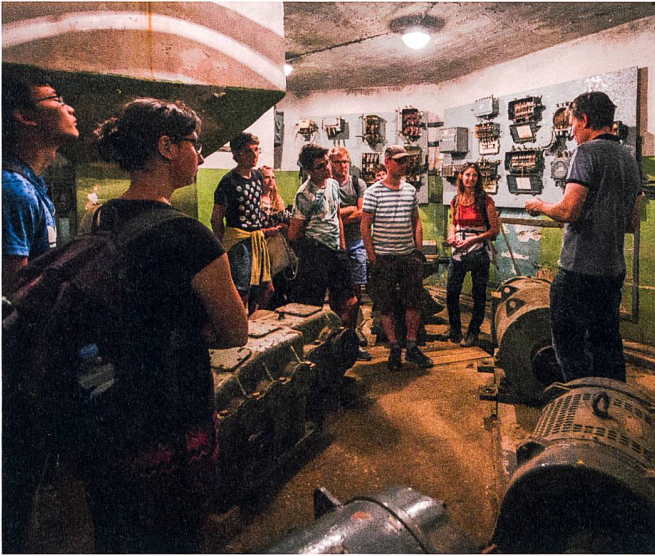
Abb. 3: Besuch Kontrollzentrum Irbene.