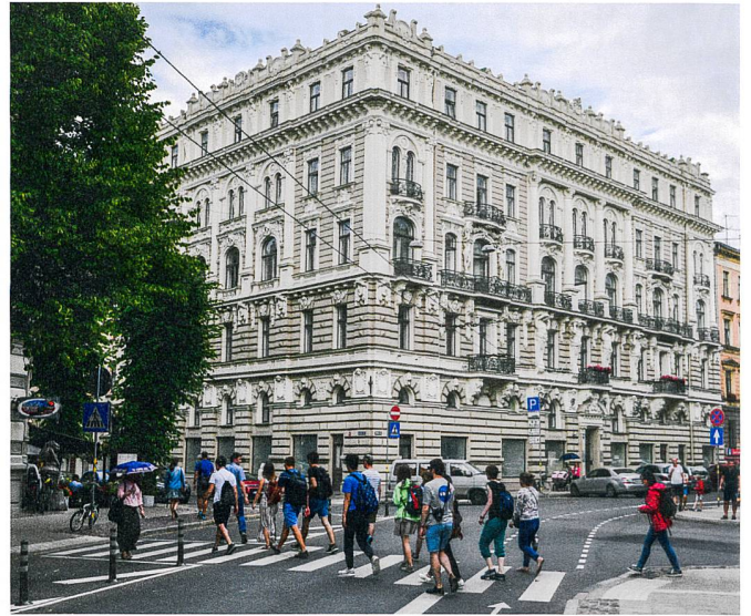
Abb. 4: Stadtrundgang Rīga.