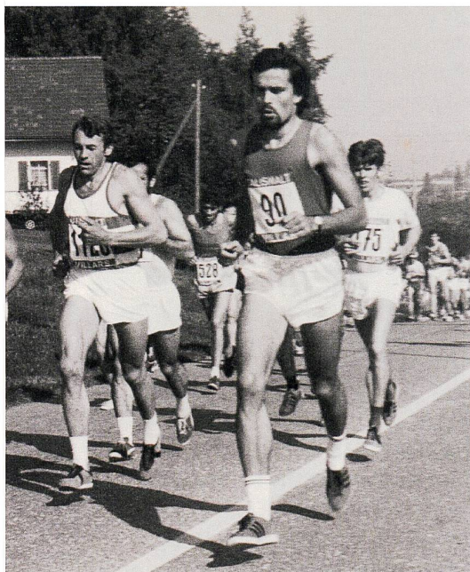
Fig. 1/Abb. 1: Morat-Fribourg 1972.

Une gestion intelligente d'un triathlon passe par une reconnaissance détaillée et précise des parcours et une gestion fine du matériel et du ravitaillement, puis un dosage de l'effort constant pour ne pas foncer «tête baissée» et éviter l'accident. La mesure au millimètre au milieu de la nature, par tous les temps tout en se déplaçant constamment d'un point à l'autre constitue un même défi : comment