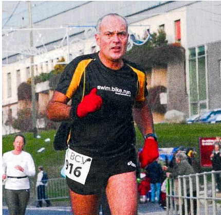
Fig. 3/Abb. 3: Prilly 2011.

effectuer des mesures fines, lire et écrire proprement, quand la transpiration vous coule dans les yeux. Le respect des règles et procédures sportives et la fiabilisation des mesures effectuées et des actes élaborés sont des éléments finalement très proches. Garder constamment la maîtrise des opérations pour assurer la qualité du résultat aussi.