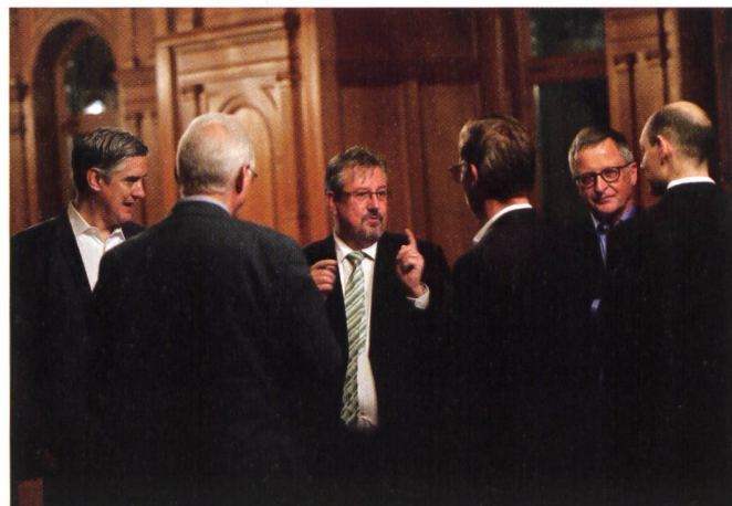
Abb. 2: Angeregte Diskussion mit SIA-Präsident Stefan Cadosch und Nationalrat Beat Flach.

Vergleich zu vorindustriellen Werten (1850-1900). Der Beitrag der Schweiz: Reduktion der CO 2 -Emissionen um 50 % bis 2030 gegenüber 1990. Ohne Massnahmen müssen wir mit einem Temperaturanstieg von 3,2 Grad bis 5,4 Grad rechnen. Heute sind es