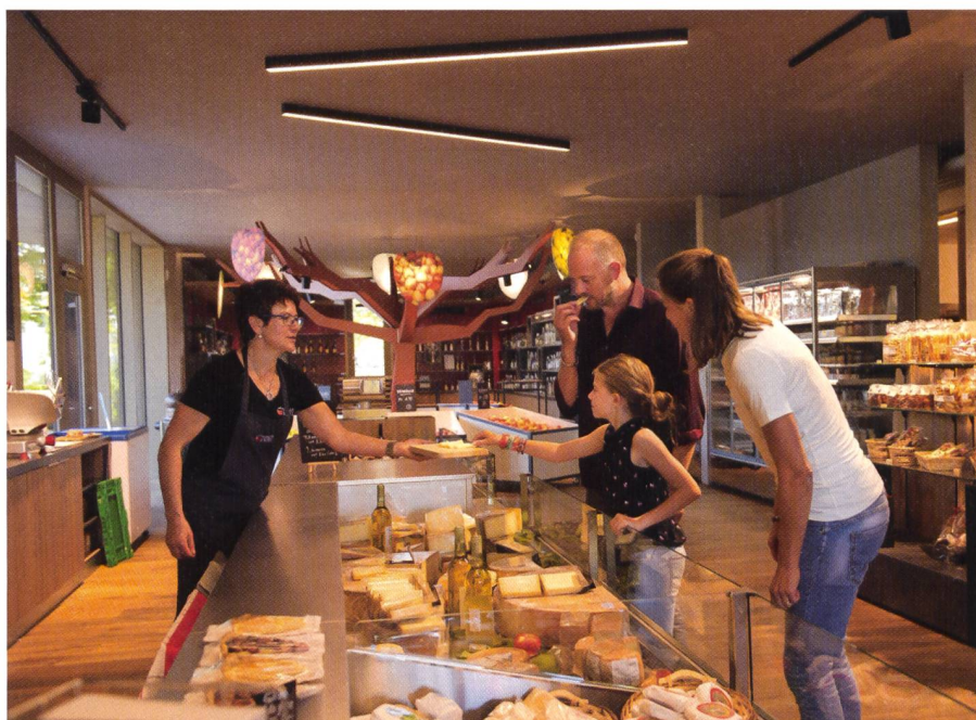
Fig. 2: PDR Marguerite.

rel que représente le cheval des Franches-Montagnes pour mettre en place un réseau de parcours équestres balisés.