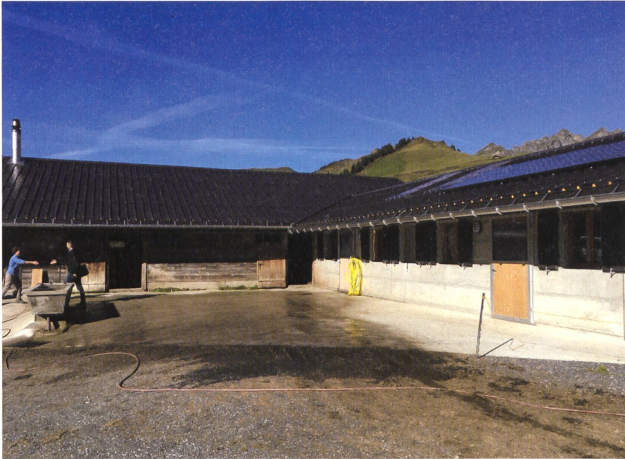
Fig. 3: PDR Val d'Illeiez.

extensions du point de vente collectif de produits du terroir «La Cavagne» déjà existant et situé à Troistorrents. Ces deux mesures permettront de valoriser les