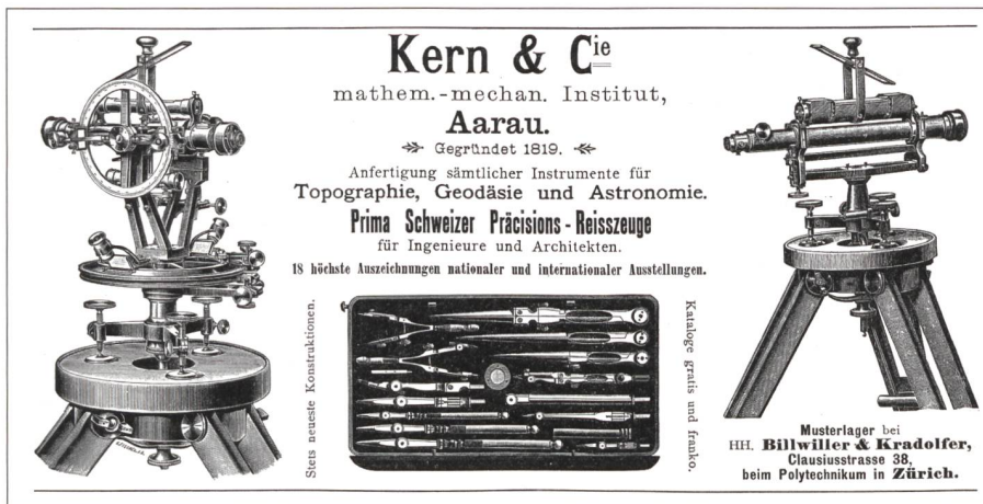
Abb. 1: Eines der ältesten Inserate aus der Schweizerischen Bauzeitung von 1899.