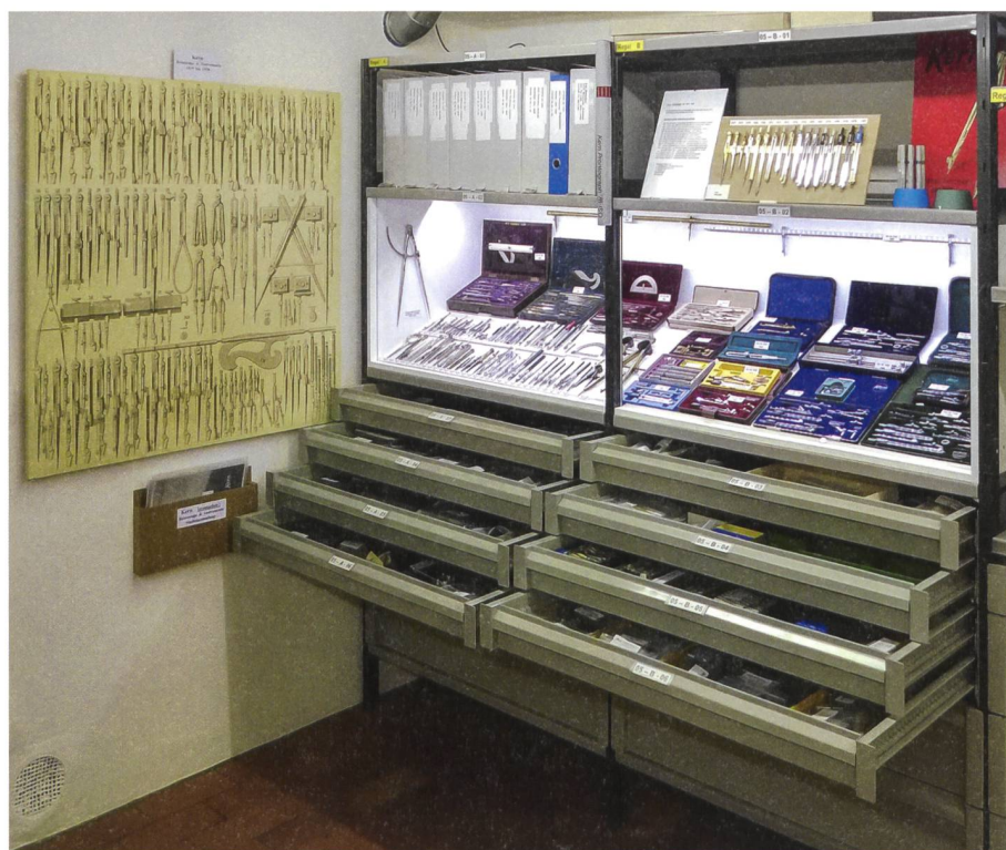
Abb. 4: Ein Blick in die Studiensammlung Kern: Einzelinstrumente und Sets aus der Reisszeug-Produktion (Foto Stadtmuseum Aarau, Sammlung Kern).

Die Studiensammlung wird von der «Arbeitsgruppe Kern» aus ehemaligen Mitarbeitenden von Kern, Mitarbeitenden des Stadtmuseums und weiteren Fachleuten erschlossen und unterhalten. Sie konnte in den letzten 30 Jahren durch Schenkungen und Leihgaben erweitert werden. Die Sammlung ist bedeutend, umfasst sie doch nicht nur eine repräsen-