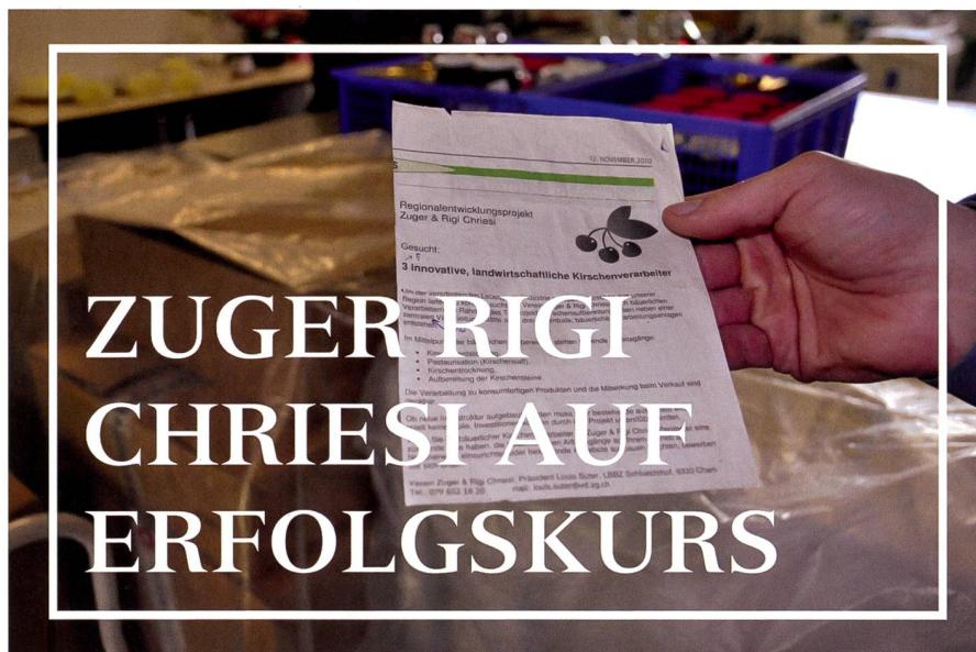
Abb. 3: Mit diesem Inserat wurden motivierte, innovative, landwirtschaftliche Kirschenverarbeiter gesucht, die die Projektidee tatkräftig umsetzen sollten.