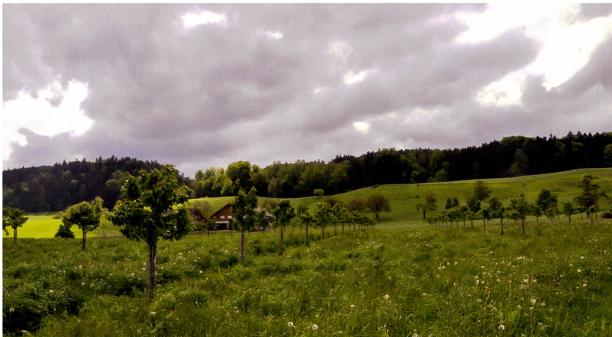
Abb. 2: Mehr als 2500 Kirschen Hochstammbäume wurden während der Projektzeit 2011 bis 2018 gepflanzt.

Kantonen Zug, Luzern und Schwyz sowie vom Bund mit Beiträgen unterstützt. Die kantonalen und nationalen Stellen förderten damit nicht nur die lokale Landwirtschaft, sondern stärken neben den regionalen Produkten auch die Werte der Standortmarken Zug (vertreten durch den Kanton Zug) und Rigi (vertreten durch die Kantone Luzern und Schwyz). Die Auszeichnungen der Standortmarken «Zuger Kirsch» und «Rigi Kirsch» mit der geschützten Ursprungsbezeichnung (AOP-IGP) und der «Zuger Kirschtorte» mit der geschützten geographischen Angabe (GGA) stärken den Wert der regionalen Produkte und der Standortmarken Zug und Rigi. Für die Herstellung der Zuger Kirschtorte darf ausschliesslich Zuger