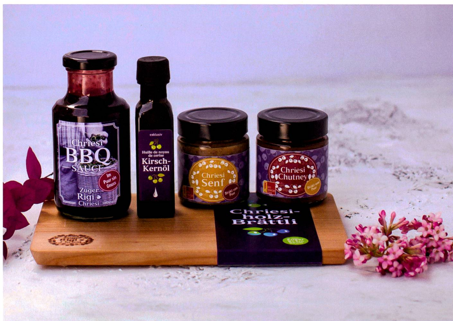
Abb. 4: Ein einheitliches Erscheinungsbild porträtiert die Marke «zuger-rigi-chriesi». Die Produkte werden mit Kirschen aus der Region Zug-Rigi regional hergestellt.

Detailhandel (Spezialitätengeschäfte, Confiseries, Coop), in der Gastronomie und auch im Geschäftsbereich (als Kundengeschenke). Die Marke zuger-rigi-chriesi ist in der Region etabliert und gewinnt langsam auch an überregionaler Bekanntheit. Dazu tragen innovative Produkte wie Chriesi BBQ Sauce oder Chriesi Chutney bei. Das heutige Produktportfolio dokumentiert, wie eine traditionelle Frucht bei der immer grösseren Nachfrage nach regionalen Produkten eine vielversprechende Zukunft hat, wenn gezielt auf aktuelle Ernährungstrends reagiert wird.