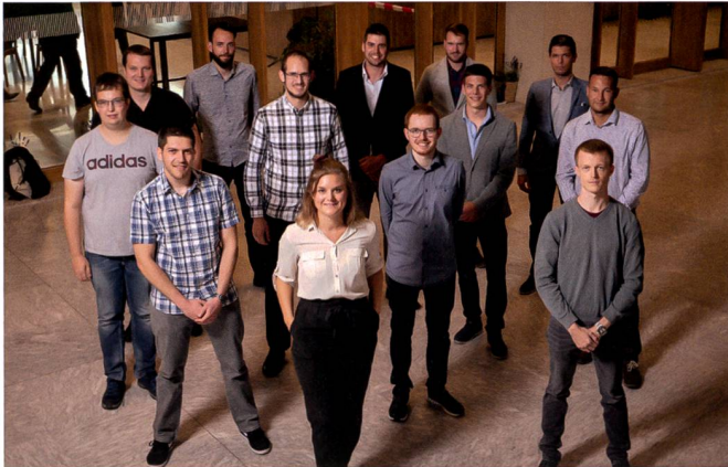
Die diplomierten Bachelor of Science in Geomatik 2020, Quelle: Simon Mader, APCC—grafisches atelier.