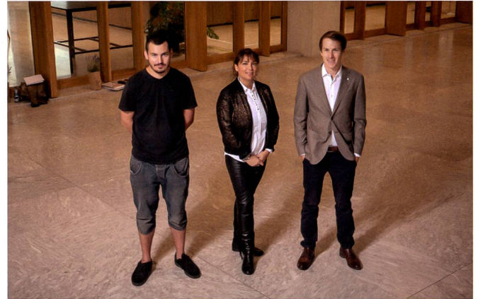
Die teilnehmenden Masterabsolventinnen und -absolventen 2020

und drei Preisträger aus dem Bachelorstudiengang Geomatik wurden für ihre Bachelorarbeiten und Studienleistungen mit Auszeichnungen von Berufsverbänden und Praxispartnern geehrt.