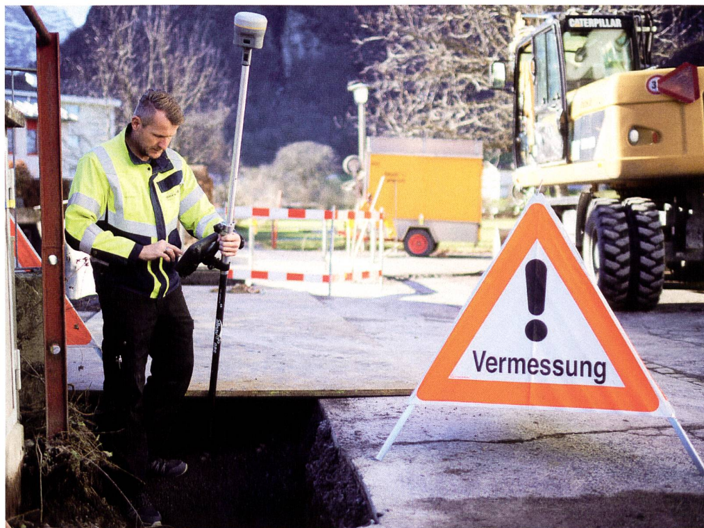
Trimble R12i mit hochgenauer Neigungskompensation mittels IMU für ein direktes, unkompliziertes und schnelles Messen – auch von überdeckten und bis anhin mit einem GNSS nicht messbaren Punkten (Foto: Technische Betriebe Glarus).

«Seit wir den R12i haben, sind wir viel näher an unseren Baustellen, da wir direkt selbst vor Ort sind. Das wird von unseren eigenen Leuten draussen sehr geschätzt, da sich Fragen zu Details oder