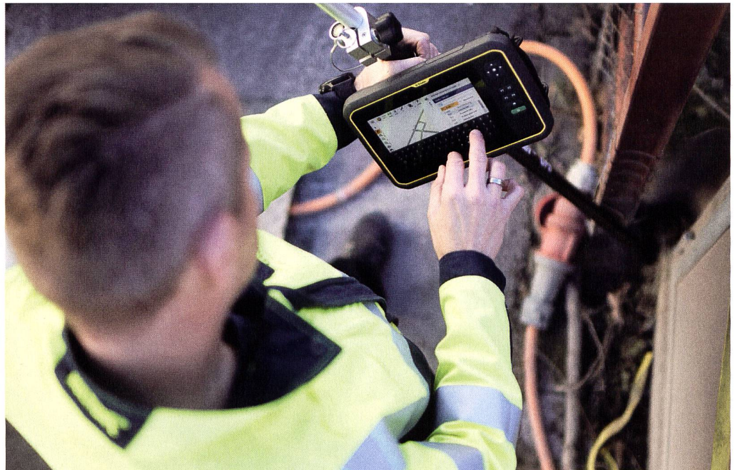
Trimble R12i mit T7 Tablet: Geodaten in der Feldsoftware Trimble Access direkt und einfach auf dem grossen und hellen Display visualisieren und nutzen.

Der R12i hat die Arbeit der GIS-Spezialisten nicht nur schneller und flexibler, sondern auch einfacher gemacht. Brägger sieht in Trimbles jüngster GNSS-Empfänger-Generation mit Neigungskompensation noch weitere Vorteile. Dass der R12i bis zu einer gewissen Schräglage mit hoher Genauigkeit arbeiten kann, sei fantastisch. Gerade an Hausecken oder an Orten mit einer ungünstigen Abdeckung wie Hecken, Bäume etc. wird durch die Möglichkeit des «schräg Haltens» des R12i eine Messung von relevanten Messpunkten deutlich erhöht. «Schon mehrmals ist es vorgekommen, dass der benötig-