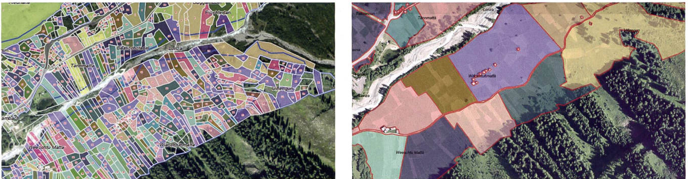
Abb. 4: Beispiel der Arrondierung im Gebiet Weestenmatt in Blatten: alter Bestand (links), neuer Bestand (rechts).

(siehe Tabelle Neubestand). Der neue Bestand wurde im September 2020 vom Staatsrat gesamthaft genehmigt und die Inbesitznahme auf den 1. November 2020 festgelegt. Der Erfolg der BA wird mittels eines zwölfjährigen Monitoringkonzepts bezüglich Landwirtschaft und Ökologie überprüft.