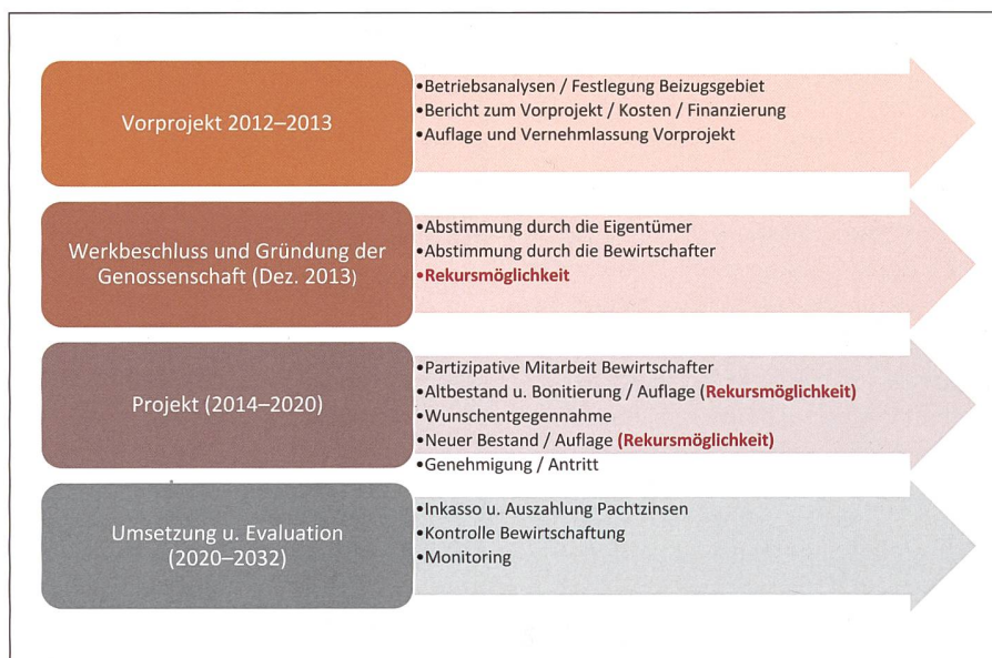
Abb. 3: Ablaufschema der Arrondierung.