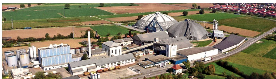
Abb. 1: Drohnenaufnahme der Schweizer Salinen, 2018, A. Meyer.

Die durchgeführten Analysen zeigen, dass die Versorgungssicherheit durch das bestehende System im Hinblick auf die räumliche Verteilung und die lokal vorhandenen Lagerkapazitäten sehr effektiv sichergestellt ist. Wegen der saisonal teureren Auftausalztarife erfolgen Nachbestellungen während des Winters in der Regel nicht direkt nach jeder Ausbringung, sondern folgen einer Salzkosten-Risikoabwägung basierend auf den vorhandenen Restbeständen und zu erwartenden