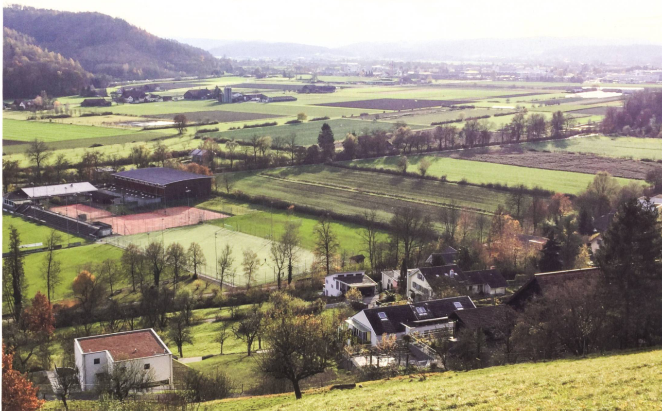
Abb. 2: Landwirtschaftliche Strukturverbesserungen prägen die ländlichen Räume (Blick ins Suhrental AG), Quelle: BLW.

Hochbau, die Landumlegungen, den landwirtschaftlichen Tiefbau, die ELR und die Projekte zur Regionalen Entwicklung (PRE). Der «Werkzeugkasten» ist damit prall gefüllt. Anhand von vier strategischen Leitsätzen soll er für die Unterstützung der künftigen Ausrichtung der Agrarpolitik genutzt werden: