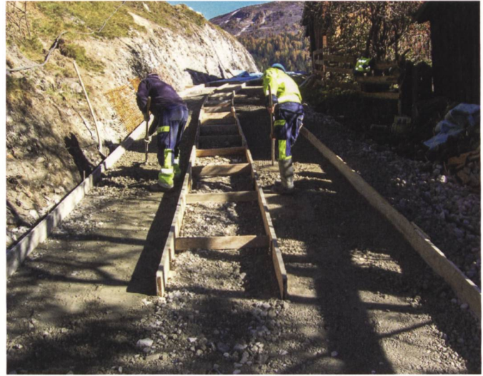
Abb. 3 und 4: Infrastrukturen zum Erhalt der Produktionsgrundlagen (Transport-, Be- und Entwässerungsinfrastruktur) sind vielerorts am Ende ihrer Lebenszeit angelangt und müssen dringend saniert werden, Quelle: BLW.

lung einer ausreichenden finanziellen Gegenleistung der Kantone, eine effiziente Ausgestaltung der Prozesse im Strukturverbesserungswesen, die Stärkung von Know-how und Kommunikation sowie der Aufbau einer Wirkungsmessung für Massnahmen der Strukturverbesserungen.