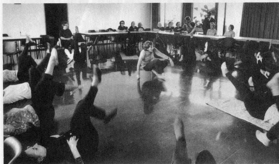
Une fois par semaine, leçon de gymnastique pour garder la forme.