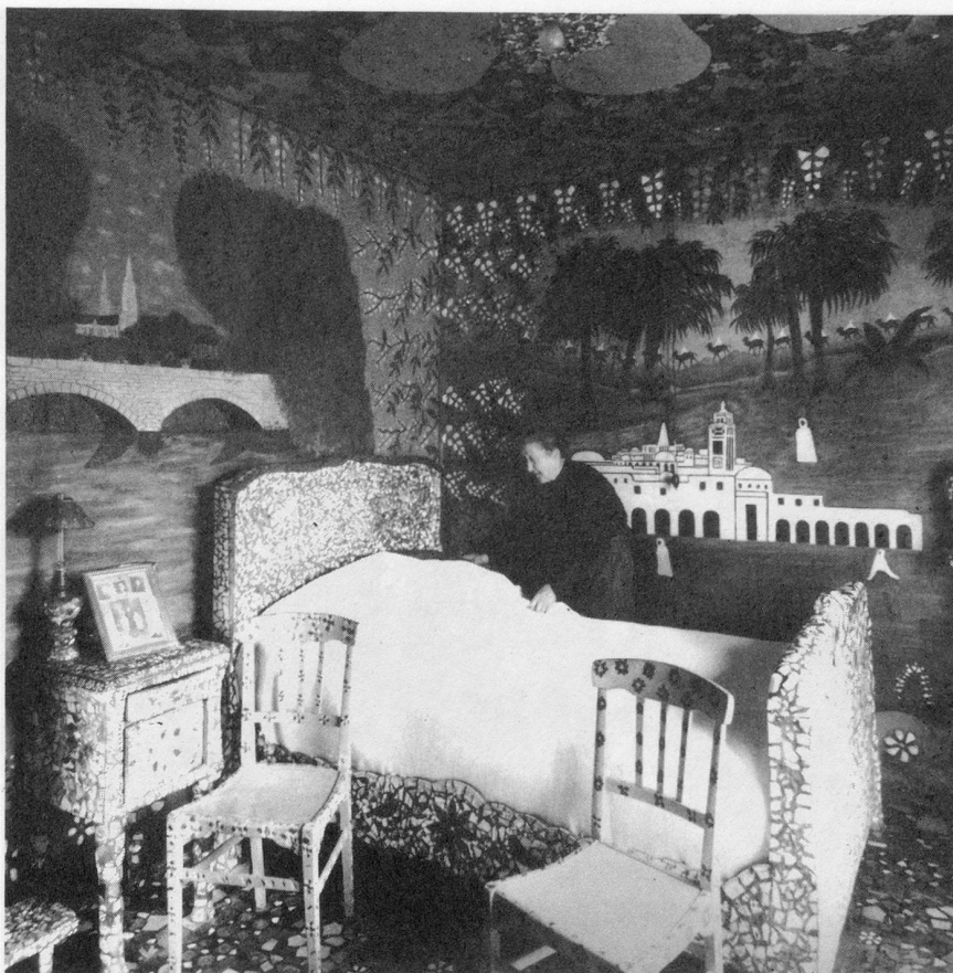
Un rêve mauresque dans la chambre à coucher.

La porte du « domaine » franchie, l'étonnement commence. On a envie de marcher sur la pointe des pieds : un homme a travaillé ici, il a tout transformé, transfiguré. Au fil des années, après avoir décoré la