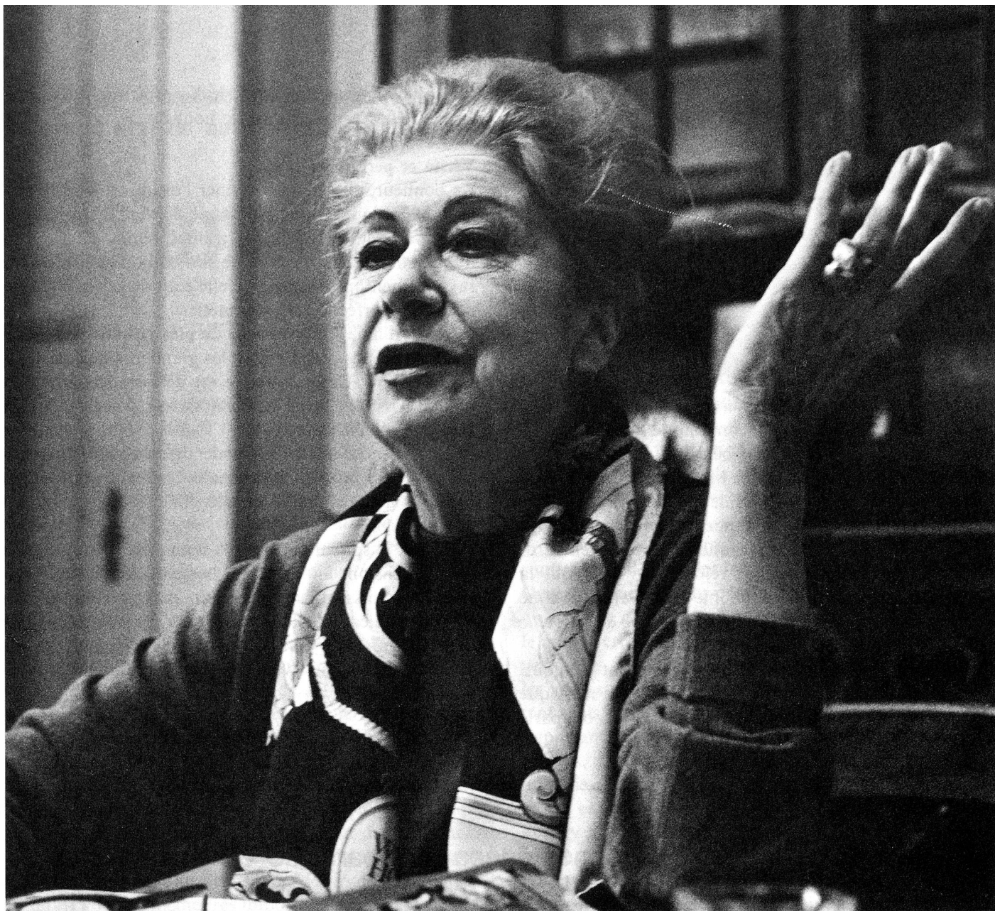
« Le bonheur, c'est sûrement l'amour... ».

« Le bonheur n'est pas de ce monde. Ce ne sont que de petits moments ajoutés les uns aux autres. Le bonheur est au-delà... »