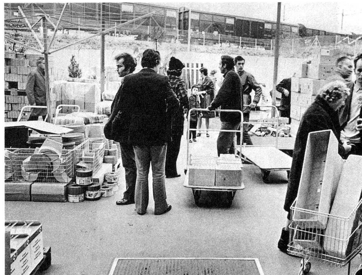
Tout pour le jardin...

pratiqué par les commerces vendant l'objet terminé. Et ce qui est vrai pour une table de salon l'est aussi pour tous les autres meubles qui s'achètent en pièces détachées au « Do it ».