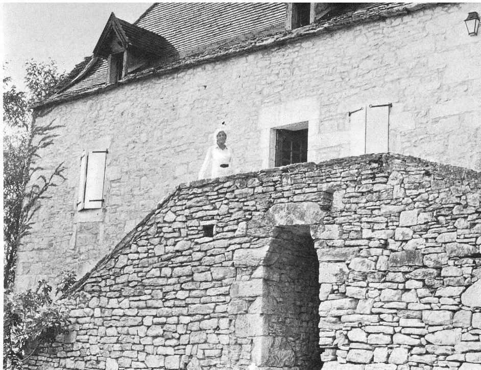
Claude Pompidou devant sa maison préférée, cachée dans la montagne de Cajarc, dans le Lot. Une maison de poupée.

De quoi, oui, de quoi parler avec une dame rencontrée pour la première fois, rayonnante d'élégance et d'intelligence, et qui, de surcroît, est la femme du président de la République française, M. Georges Pompidou ?