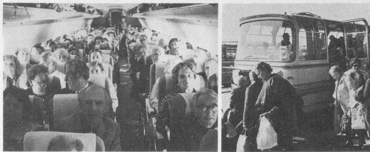
Les moyens de transport les plus modernes à la disposition des retraités: jet et car.