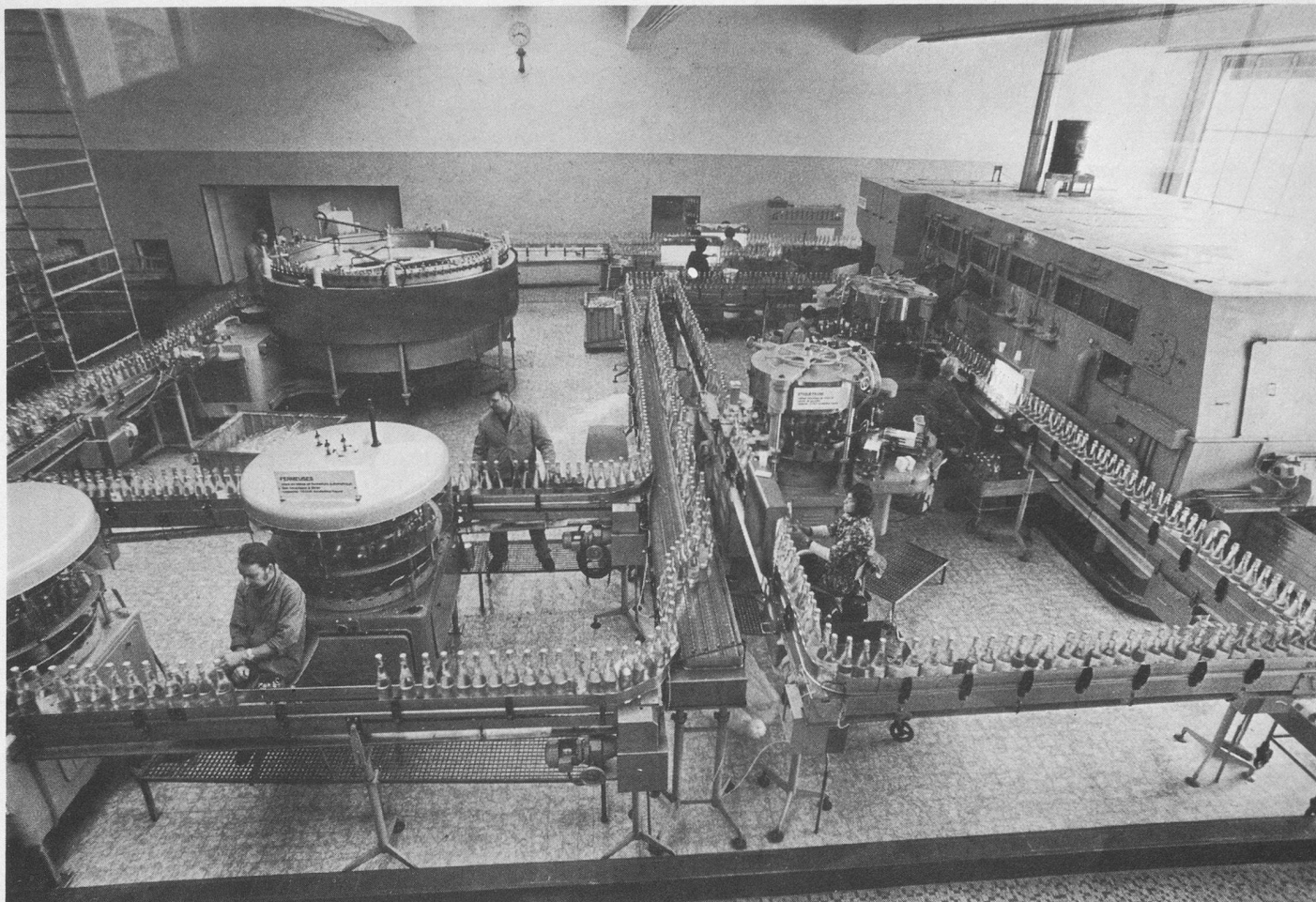
Des laveuses géantes aux fermeuses, le miracle de l'automatisme tout au long d'un itinéraire savant.

à leur minéralisation bien équilibrée, elles permettent aux reins de travailler facilement.