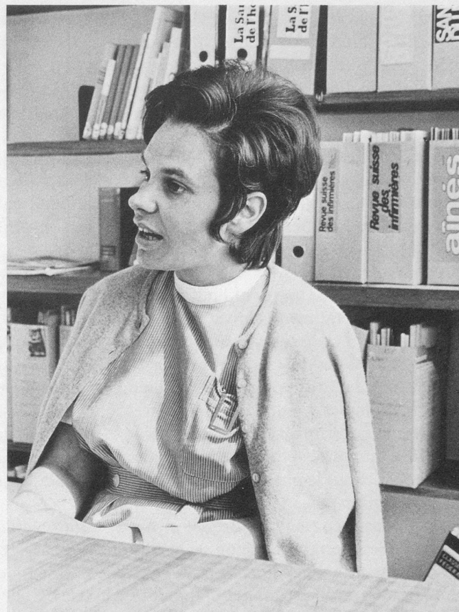
Toujours attentive aux problèmes d'autrui.

L'hospitalisation à domicile est la mise en place de tout un service médico-social qui permet de renvoyer quelqu'un chez lui plus tôt et de le garder ainsi le moins longtemps possible à l'hôpital, ce qui a l'avantage précieux de laisser des lits disponibles pour d'autres personnes.