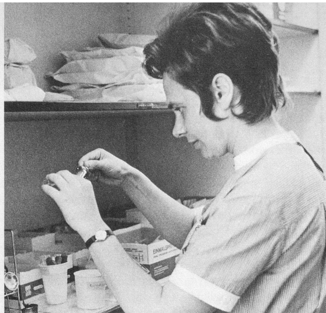
Une visite médicale, cela se prépare.

Ce service ne s'adresse pas seulement aux personnes âgées.