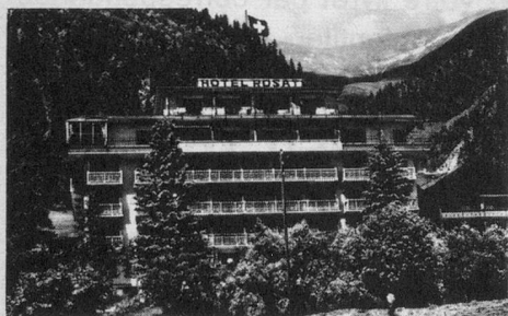
HOTEL ROSAT 1837 Château-d'Œx Altitude 1000 m. Tél. (029) 4 62 12

Les ravissants salons de jardin comprenant table, fauteuils, chaises, parasol, balancelle et nappe, le tout harmonieusement assorti, sont assez coûteux. Toutefois, sans beaucoup de frais, il est aisé de se composer son propre ensemble. Quelques bancs, une table de bois ou de fer laqués — le blanc tranche admirablement sur le gazon — quelques fauteuils, feront de votre jardin un coin confortable. Toutefois, si une averse vient à tomber, les meubles en plastique sont pratiques. Le grand classique de l'ameublement de plein air reste le bois laqué qui supporte l'ondée, mais doit être essuyé et repeint au bout de deux à trois années. Ne boudez pas le rotin et l'osier, matériaux traditionnels du jardin. Si vous disposez de fort peu de place, choisissez des meubles italiens « mini-encombrement ». Et pour garder un coin de fraîcheur, n'oubliez pas le parasol ou la parasolette de fauteuil. Plus les teintes de ces écrans solaires seront vives, plus elles égayeront votre jardin. Peut-être aimez-vous posséder un hamac pour piquer un petit somme ? Si les arbres suffisamment solides manquent, il existe des montures métalliques pour hamacs. Avec un rien de fantaisie et de goût, on peut s'oxygéner sans quitter son chez-soi.