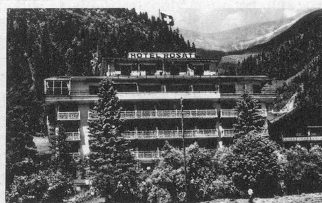
HOTEL ROSAT 1837 Château-d'Œx Altitude 1000 m. Tél. (029) 4 62 12

Quant au magnésium, il en est comme de toutes les bonnes choses: il ne faut pas en abuser. Il fait partie de ce qu'on appelle les oligo-éléments ce qui, comme le nom l'indique, veut dire en petite quantité. De faibles doses sont salutaires, mais encore ne faut-il pas exagérer.