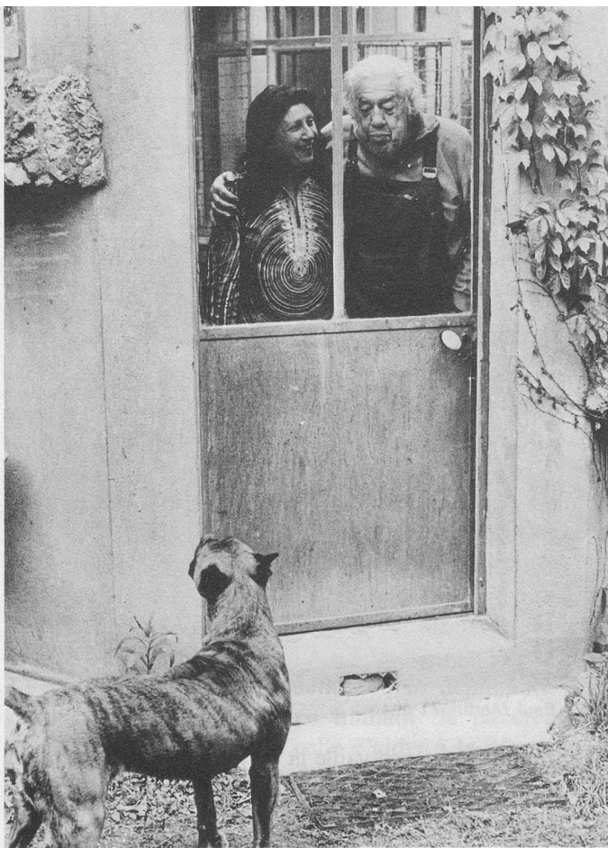
Linda le boxer voudrait jouer.