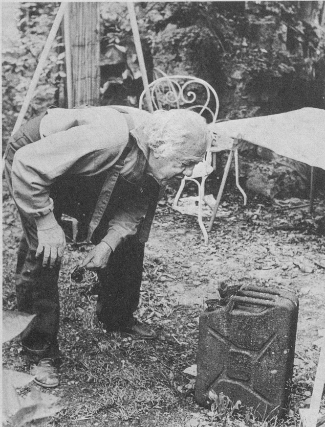
Dans ce jerrycan, des mésanges à tête noire ont élu domicile.