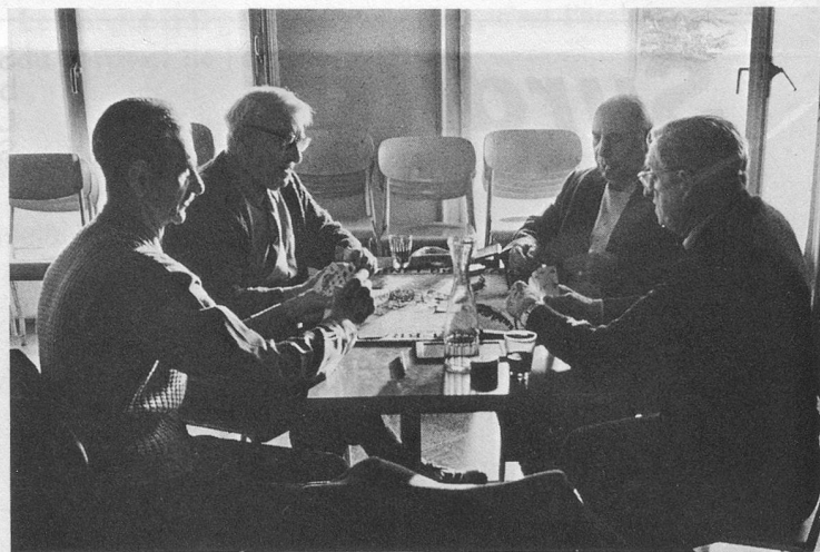
Même sans flash, de bonnes photos d'intérieur sont possibles.

Sur les appareils plus compliqués, le réglage du diaphragme se fait selon des chiffres, par exemple: 2,8 - 4 - 5,6 - 8 - 11 - 16... La plus grande ouverture est 2,8 dans ce cas; à utiliser par faible lumière. A l'opposé, 16 est le réglage le plus fermé du diaphragme, à utiliser en plein soleil.