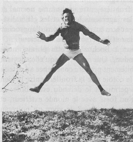
Cette photo a été prise au 1/500 e de seconde.

La dernière fois, nous vous avons montré une photo bougée. Ceci posait le problème de la vitesse. Vous savez que, pour prendre une photo, un mécanisme, appelé obturateur, obéissant à votre index, laisse pénétrer la lumière derrière l'objectif pendant une fraction de