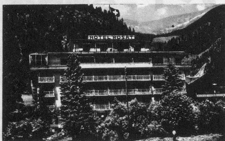
HOTEL ROSAT 1837 Château-d'Oex Altitude 1000 m. Tél. (029) 4 62 12

Le médecin consulté à temps va s'apercevoir que la prostate est un peu grosse, généralement la partie droite de cette prostate ayant augmenté de volume. A ce stade, il est possible encore par un traitement médicamenteux d'essayer d'empêcher l'évolution de la maladie. Un traitement suivi régulièrement par des extraits glandulaires permet de limiter ou de contrôler l'évolution de cette hypertrophie de la prostate.