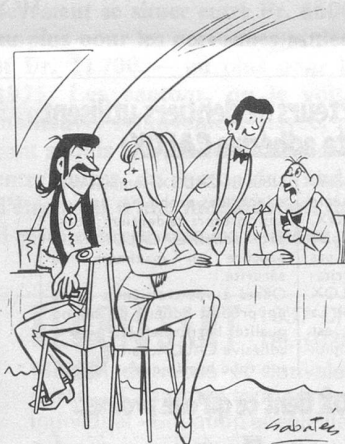
Garçon... faites des additions séparées, s.v.p.!