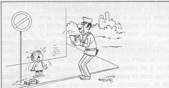
Histoire sans paroles. (Dessin de Sabatès)