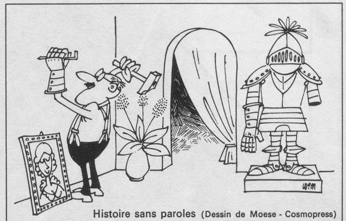
Histoire sans paroles (Dessin de Moese - Cosmopress)