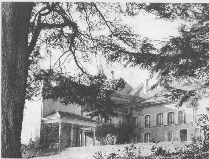
Le château de Constantine, trois fois séculaire.